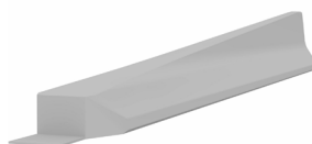
Elemento terminal RB80_7T (pendiente 1:12)