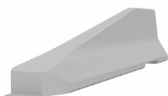
Elemento terminal RB80_4T (pendiente 1:5)